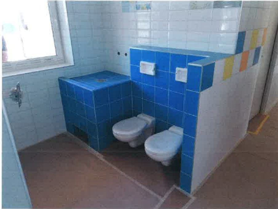
5. fotó – az elkészült burkolat a gyerekmosdóban (a szerelvényezés folyamatban van padlóburkolat letakarva a festési munkák miatt)