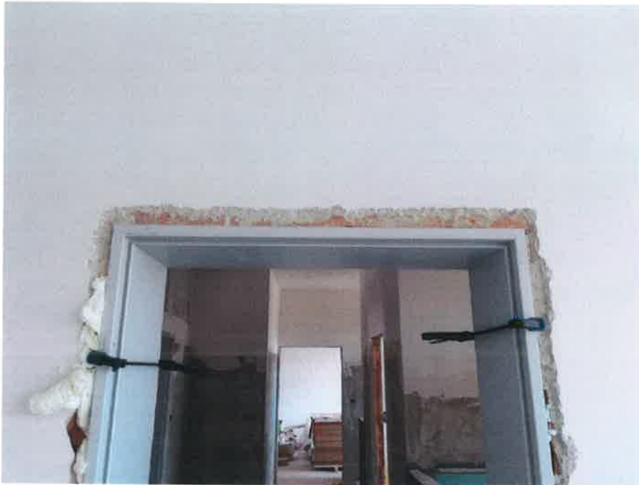
3. fotó – burkoló munkák előtt a belső nyílászárók beépítésének fotója