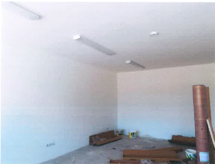
10. fotó – az egyik foglalkoztató (az első réteg diszperziós festés utáni villamos szerelvényezés folyamatban)