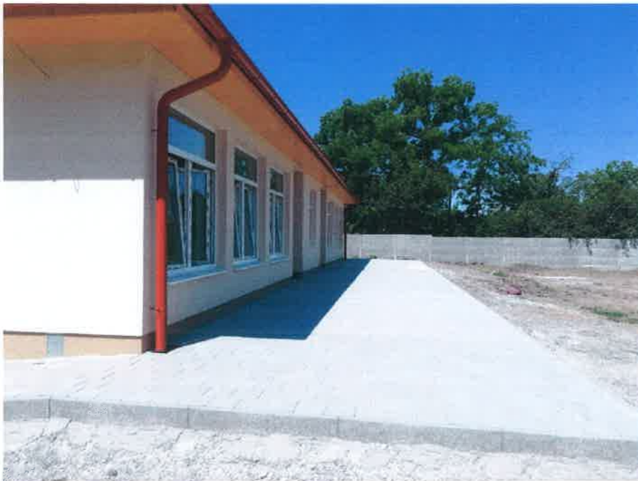
2. fotó – fotó az épület mögötti térkövezett terasról