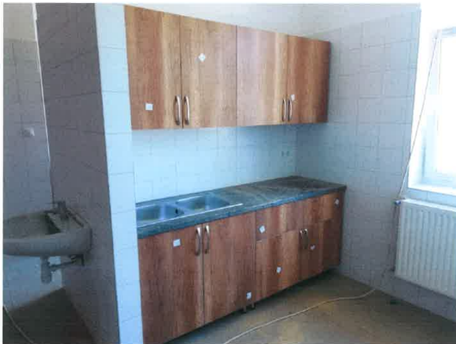
8. fotó – az elkészült burkolat a bölcsőde konyha részén (a beépített berendezési tárgyak elhelyezve, fűtőtestek felszerelve, szerelvényezés folyamatban)