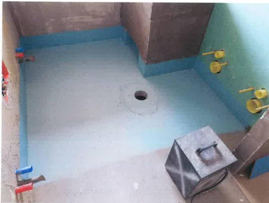
4. fotó – burkolat előkészítő, technológiai víz elleni szigetelési munka a gyerekmosdóban