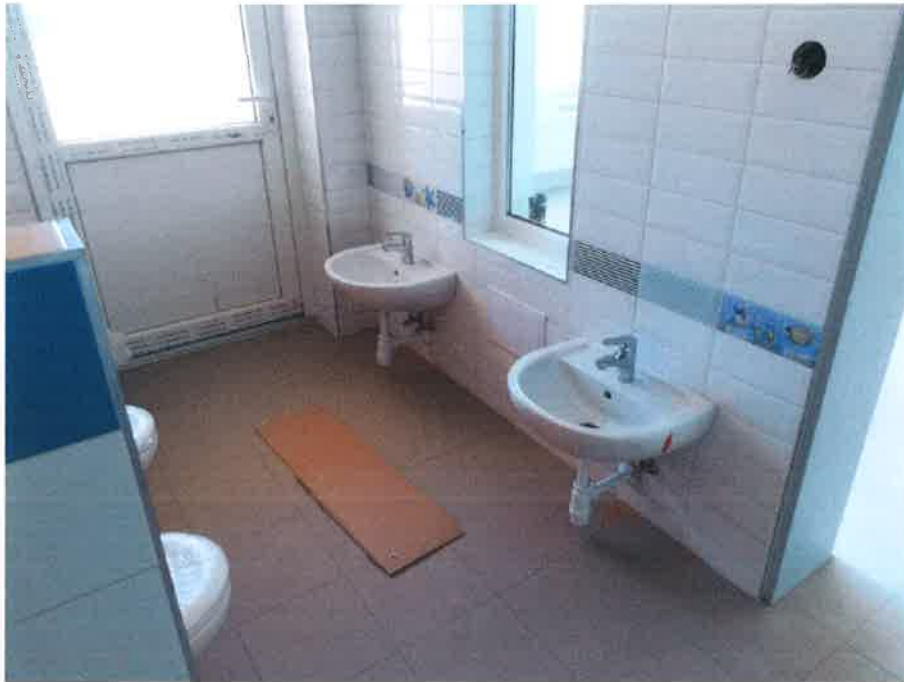
7. fotó – az elkészült burkolat a gyerekmosdóban –mosdók (belső ablak és belső ajtó is beépítve)