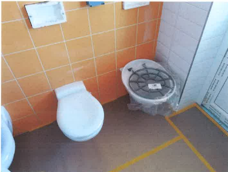
6. fotó – az elkészült burkolat a gyerek mosdóban – WC és bilimosó (a szerelvényezés folyamatban van padlóburkolat letakarva a festési munkák miatt)