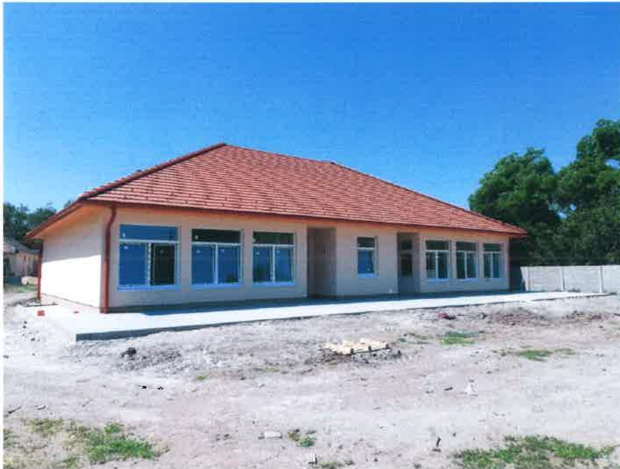
1. fotó - hátsókeri homlokzat, az elkészült térkövezett terasszal