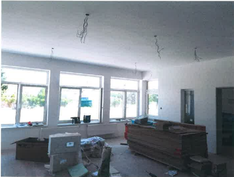
9. fotó – kép az egyik foglalkoztatóról (belső ajtók beépítve, fűtőtestek felszerelve festési munkák folyamatban)