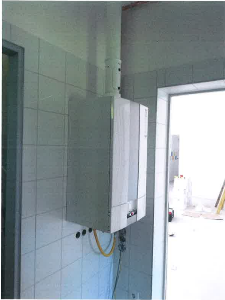
11. fotó – gázkazán és égéstermék elvezetője